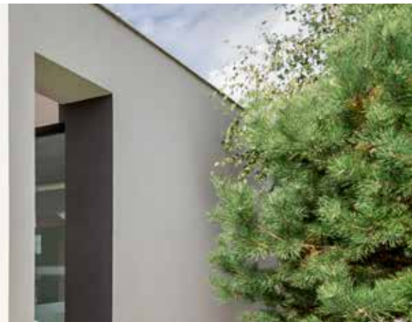
Diplomat Inverter Mini